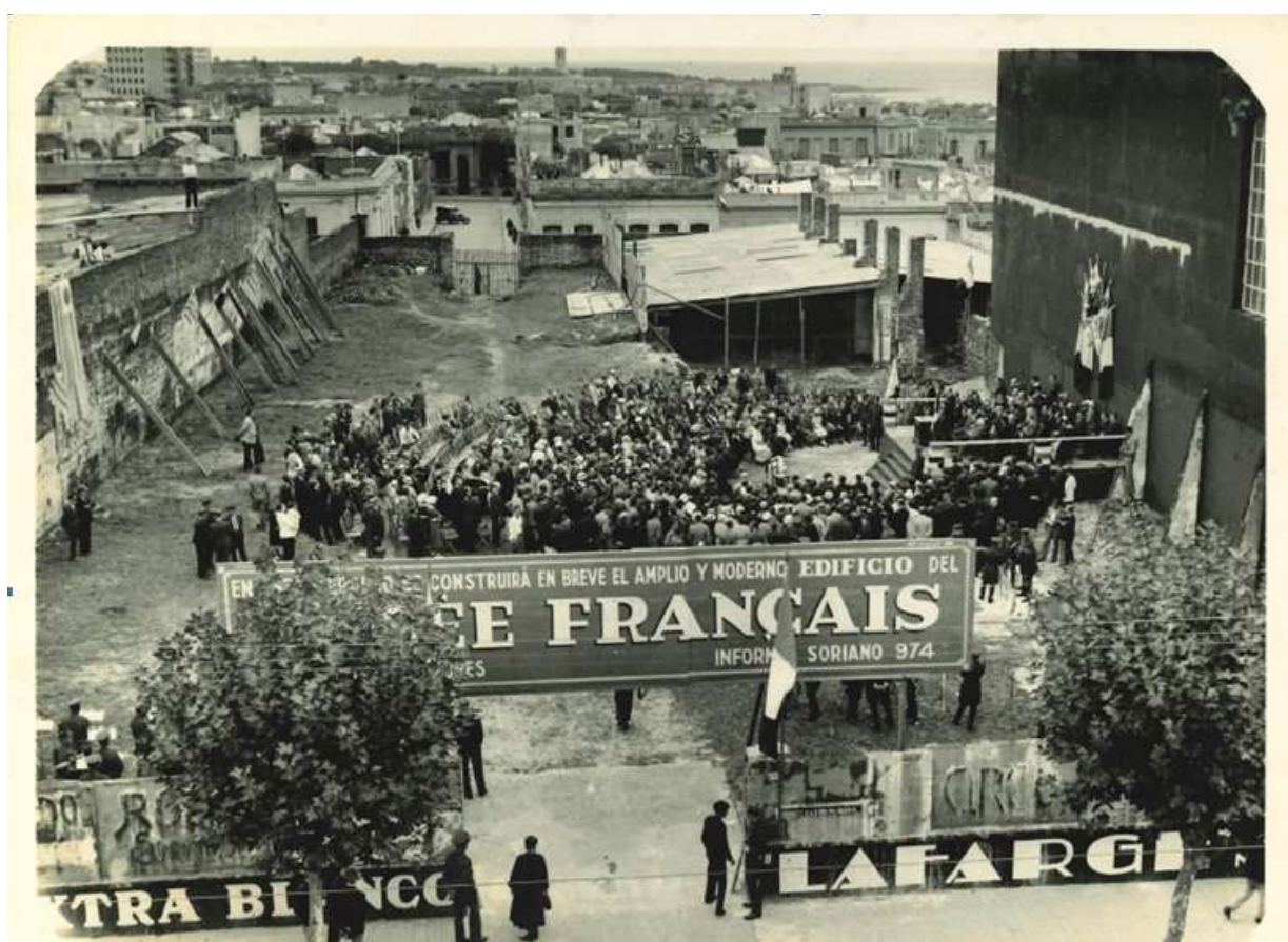
Figura 3. Liceo Francés. Colocación de la piedra fundamental en su sede de la avenida 18 de julio. Marzo 1936.

Dubourdieu jugó un papel muy destacado en el traslado del Liceo Francés a su sede principal de la avenida 18 de Julio. Su piedra fundamental se colocó en marzo de 1936 (Figura 3).