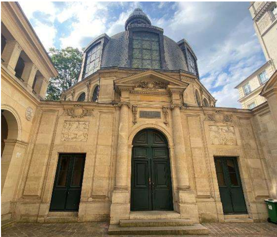
Foto 6. Puerta del Anfiteatro de San Cosme. Se destaca un acceso principal tocado por una placa de mármol con una inscripción en latín (*) y dos laterales; estos últimos coronados por sendos bajo-relieves alegóricos.