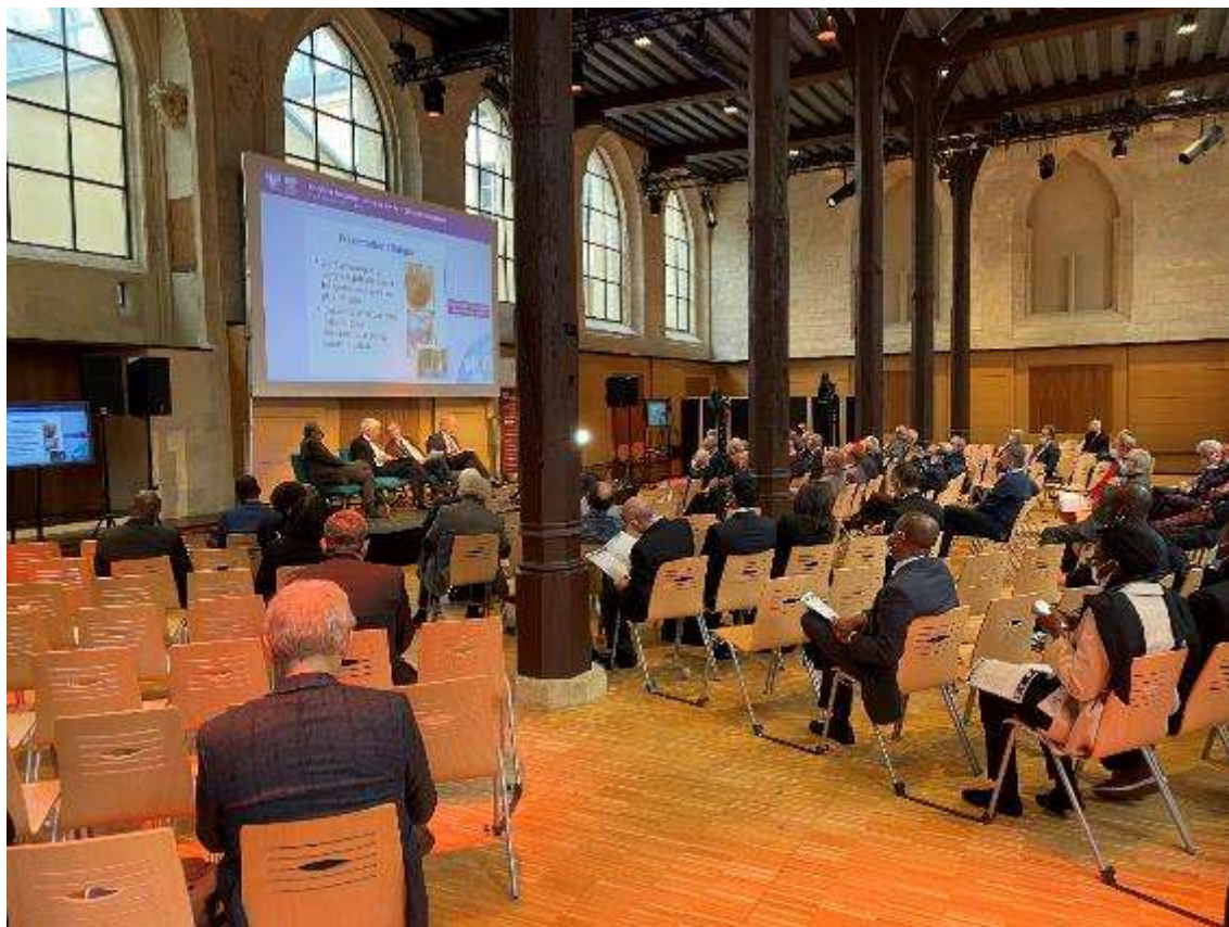
Foto 4. Vista interior de Convento, transformado en sala de conferencias