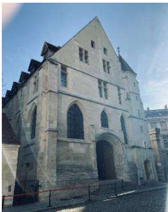
Foto 3. Vista actual de la entrada al refectorio del Convento des Cordeliers .

Después de este episodio singular, con el desarrollo de la Facultad de Medicina (Paris V- Descartes) y la Universidad de la Sorbona, provocó en 1767, una nueva asignación de varias partes del antiguo convento - incluido el claustro y el anfiteatro de anatomía - a la Escuela Gratuita de Diseño. Solo a ésta hacen referencia las placas ubicadas sobre su puerta y a la enseñanza de la aritmética, geometría, escultura en piedra y madera, dibujo de arquitectura, así como dibujo de flores y escultura ornamental y de animales y figuras humanas y otra recuerda que allí nació Henriette-Rosine Bernard el 22 o 23 de octubre de 1844, conocida como Sarah Bernhardt “la princesa del gesto”, una leyenda del teatro francés, immortalizada por su actuación en la Dama de las Camelias , de Dumas (1852 – Theatre du Vaudeville, Paris) y Ruy Blas, de Hugo (1838 - Theatre de la Renaissance, Paris)... pero de la enseñanza de la anatomía, nada. De hecho, el Instituto de Lenguas Modernas de la Sorbonne, ocupa aún parte de estos edificios. Luego de ser considerado para la recepción de un museo, el refectorio, único vestigio del convento original, se redimensiona en 1975. Actualmente tiene 57 m de largo y 17 m de ancho y data del siglo XIV. El comedor de 700 m 2 se ha transformado en un espacio polifuncional como centro de convenciones, para realización de eventos científicos, a cargo de la Academia Nacional de Cirugía de Francia (Fotos 3 y 4).