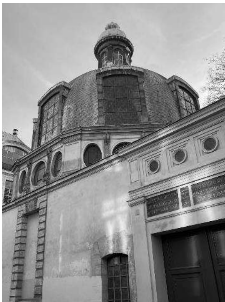
Foto 5. Vista exterior del Anfiteatro de Anatomía de San Cosme, con su arquitectura circular, cúpula vidriada y el farol en el vértice.

Esta Cofradía se desarrolló de tal forma que sus miembros pudieron instalar en 1694 un anfiteatro de Anatomía en el 5 de la Rue des Cordeliers, a razón que algunos de ellos - como Georges Marechal- adquirieron gran notoriedad tratando al Rey Luis XIV (1638-1715) y a otros grandes personajes de Francia. Lo construyeron Charles y Louis Joubert, entre 1691 y 1695 como un magnífico edificio octogonal tocado por un domo con altas ventanas y un farol en el vértice; (Foto 5) destinado a la creación de un espacio práctico para llevar adelante la enseñanza de la cirugía; lo cual provocó la ira de los catedráticos de medicina de la época.