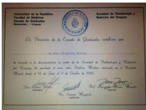
Figura 12. Curso Piloto Teórico-Práctico de Diabetes de la SDNU. Certificado emitido por la Escuela de Graduados de la Fmed/Udelar junto a la SDNU, 1986.

ocho Cursos (1987-1999) y siete Jornadas de Actualización (reciclaje) para ex-alumnos (1992-2005), formándose 54 especialistas en diabetes en Montevideo y 30 en el interior.