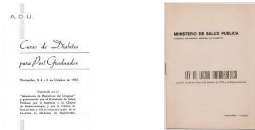
Figura 4. Primer Curso de Diabetes para Posgraduados en 1957 (izquierda) y Ley de Lucha Antidiabética en 1971 (derecha).