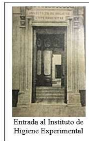
Entrada al Instituto de Higiene Experimental