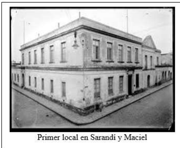
Primer local en Sarandí y Maciel