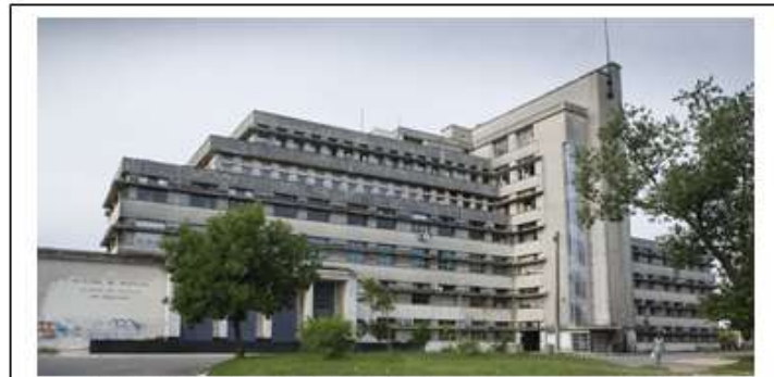
Edificio actual: Calle Alfredo Navarro 3051