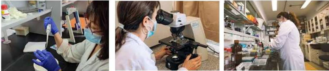
Figura 5. El Instituto de Higiene “Prof. Arnoldo Berta” hoy

Hoy el Instituto de Higiene “Prof. Arnoldo Berta” se encuentra en la vanguardia de muchos procesos de generación de conocimientos, educación, asistencia y esfuerzos para aportar soluciones a variados problemas de salud de la comunidad, en sus distintas áreas de conocimiento y con la visión centrada en “Una Salud”.